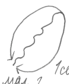
мал. 2 1сек.